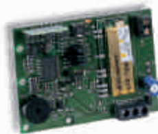
РАДИОПРИЁМНИК UNICO MEMORY SYSTEM