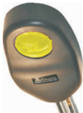
BOXER 60 NG

APRIBOX - электромеханические потолочные приводы с цепной передачей, предназначенные для автоматизации секционных и подъёмно-поворотных гаражных ворот.