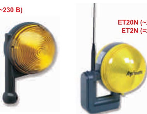
ET20N (~230 В) ET2N (=24 В)