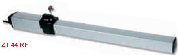
ZT 44 RF

Гидравлические приводы для бытовых распашных ворот.